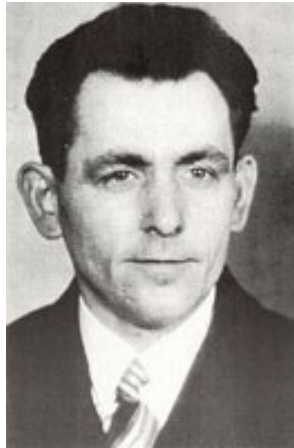
Georg Elser (1938) 1

Der 8. November ist es wert, Georg Elser zu gedenken. Sein Leben zeigt die Möglichkeiten des Individuums im Umgang mit einem negativen Zeitgeschehen