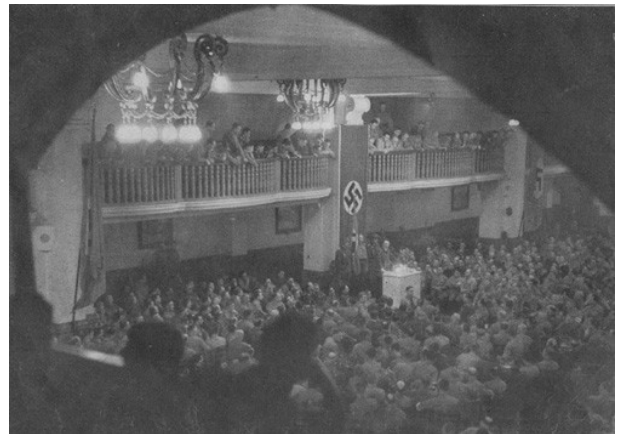
Bürgerbräukeller in München. Links ohne Menschen und rechts mit Hitler während seiner Rede am 8.11.1939. Im Inneren der Säule – direkt hinter dem Redner Hitler – tickt Elzers Bombe.

Um 21.20 Uhr am 8.11.1939 explodierte Georg Elzers Bombe im Bürgerbräukeller. Es gab 8 Tote und 63 Verletzte. Adolf Hitler hat um 21.07 Uhr den Saal verlassen, weil er rasch wieder in Berlin sein wollte. Ein Sonderzug wurde eingesetzt, weil der Pilot Hitlers Nebel befürchtete und ein Flug aufgrund des Herbstnebels nicht möglich gewesen wäre.